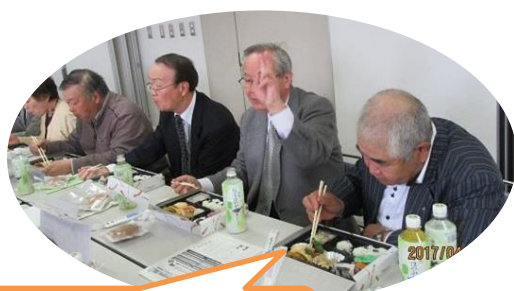
豪華? お弁当を食べ懇親会