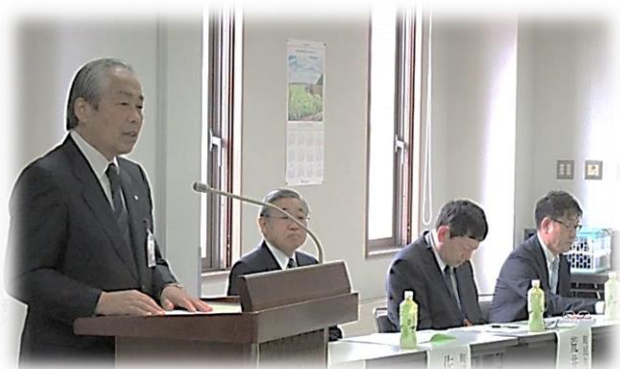
小野新町長も来賓として出席