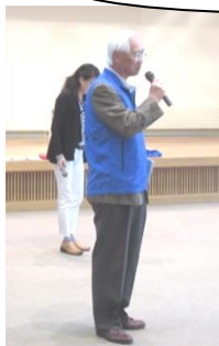
コミセンで事前説明

啓発場所：スーパーOK、ダイイチ音更店、ぴあざフクハラ音更店、ハピオ木野 (広報車で町内を巡回)