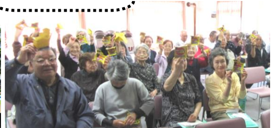
緑陽台老人クラブ