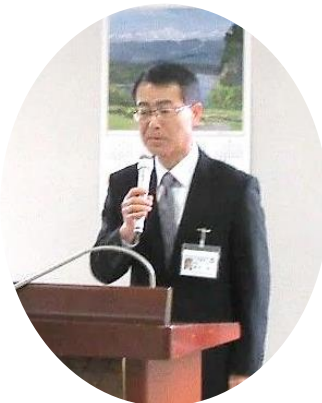
来賓の高木副町長