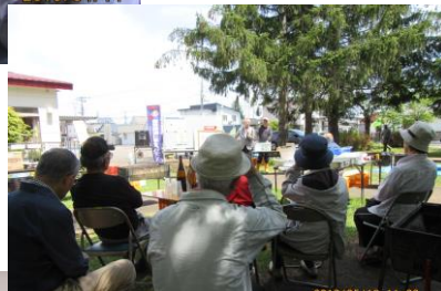
緑陽台仲区西町内会