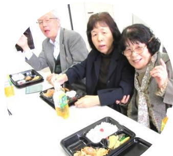
引き続いて懇親会を!