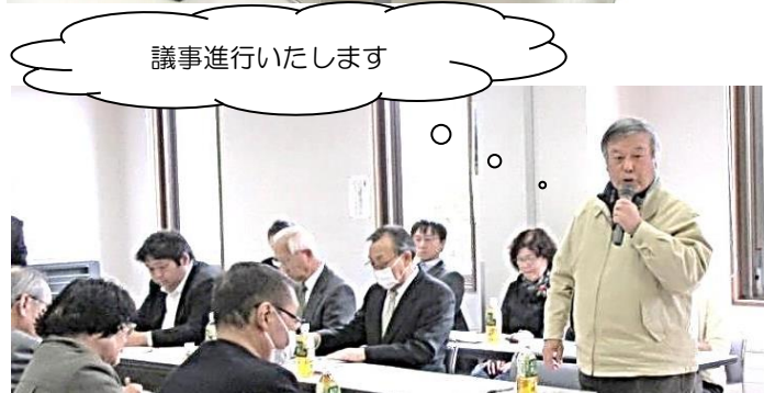
議事進行いたします