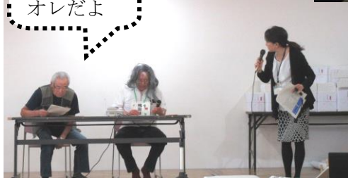
緑陽台老人クラブ