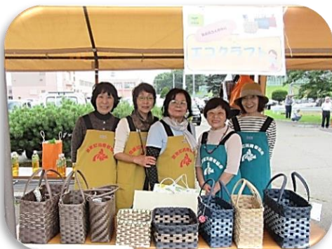
手作りのエコクラフトバッグも大人気でした