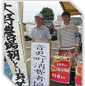
今回も朝採れ野菜は大盛況！